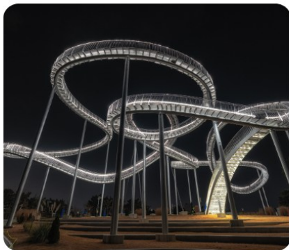
โพอ็องสเปซวอร์ค