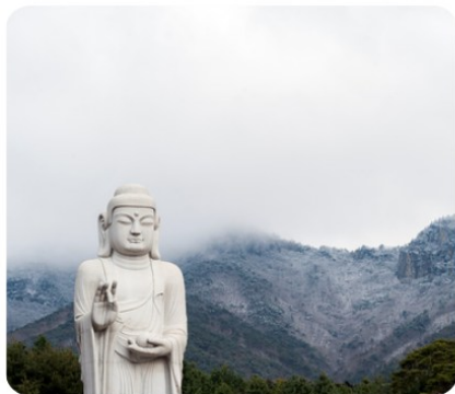
อุทยานฯ พัลกงซาน