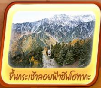
ขึ้นกระเช้าลอยฟ้าชินโงทากะ

เต็มอิ่ม! บุฟเฟ่ต์ ซาปูแบบไม่อื่น ซาปู และ ปิ้งย่างยากิniku บุฟเฟ่ต์