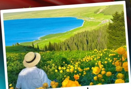
ทะเลสาบไซหลิน