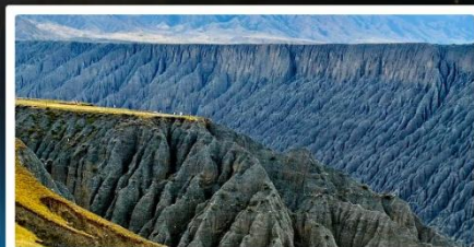
แกรนด์แคนยอนคู้ซานจื่อ