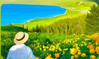
ทะเลสาบไซท์ลี่มู่