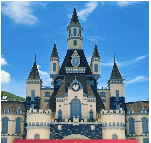
เกาะวินเพิร์ลแลนด์

เที่ยง บริการอาหารกลางวัน ณ ภัตตาคาร พิเศษ ... เมนูบุฟเฟต์บนเกาะ