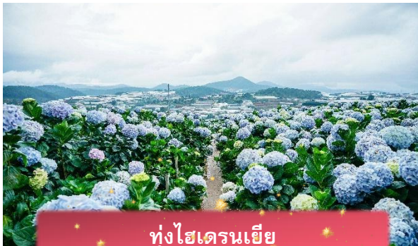
ทุ่งไฮเดรนเยีย

นำท่านเล่น นั่งโรลเลอร์โคสเตอร์ ชมธรรมชาติท่ามกลางป่าสนไปยัง น้ำตกตาดันลา สัมผัสอากาศบริสุทธิ์และบรรยากาศสดชื่น พร้อมจิบเครื่องดื่มชมวิวธรรมชาติ นำท่านเดินทางสู่ ทุ่งไฮเดรนเยีย อีกหนึ่งทุ่งดอกไม้ ที่ไม่ควรพลาดมาถ่ายรูปกัน ข้อดีของที่นี่ คือ ดอกไม้จะบานตลอดทั้งปี