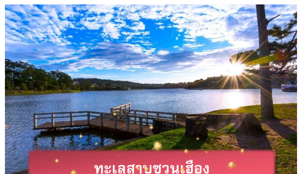
ทะเลสาบชวณเือง

ที่พัก The Western Hill ระดับ 4 ดาวหรือเทียบเท่า