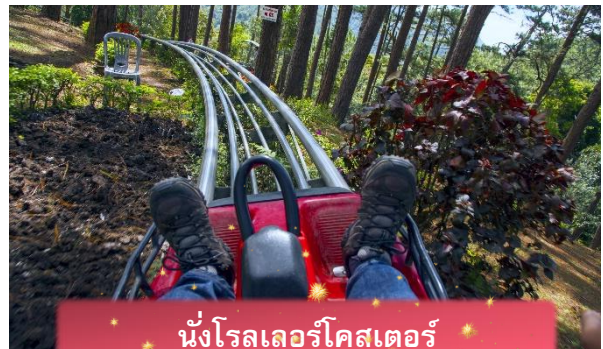
นั่งโรลเลอร์โคสเตอร์