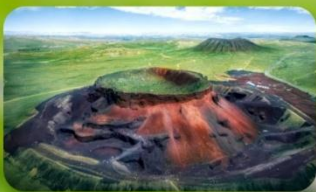
ภูเขาไฟอูลันคา