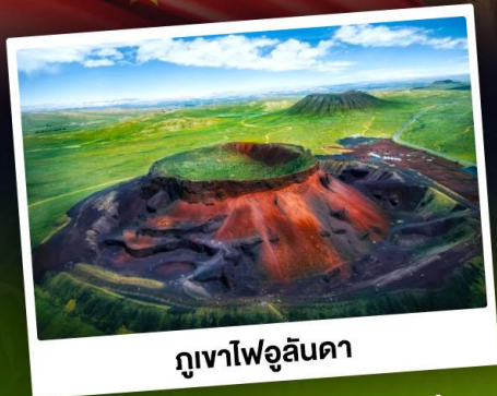
ภูเขาไฟอูลันดา

ท่องเที่ยวแดนแห่งทะเลทรายและทุ่งหญ้า ชมพระอาทิตย์ขึ้นทุ่งหญ้าออร์ดอส