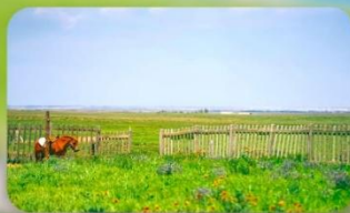
ทุ่งหญ้าออร์คอส