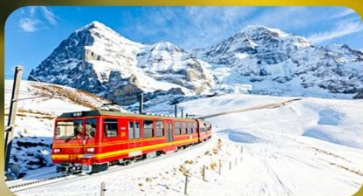
พิชิตยอดเขาจุงเฟรา

พักที่ Pullman Paris Tour Eiffel Hotel พิเศษ !!! ห้องระเบียบจิวทอโอฟา หรือระดับเทียบเท่า