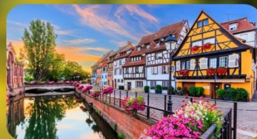
ดินแดนแห่งเทพนิยาย กอลมาร์