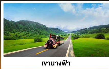
เขานางฟ้า