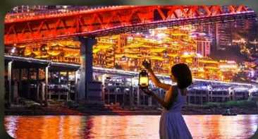
สวนริมแม่น้ำแกรนด์เธียร์เตอร์