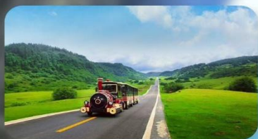
เจานางฟ้า