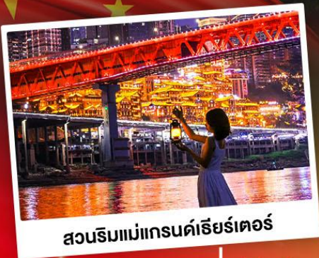
สวนริมน้ำแอมแกรนด์เธียร์เตอร์