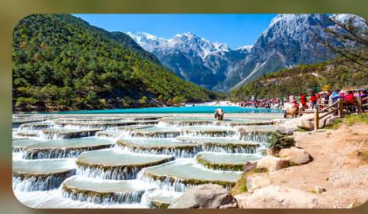
ทะเลสาบไป๋สุยเหอ