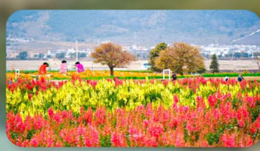
สวนดอกไม้ฮัวอวี่มู่ฉาง