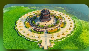
วัดฉงหยวน