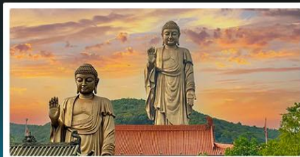
พระใหญ่หลิงซาน