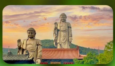
พระใหญ่หลิงชาน