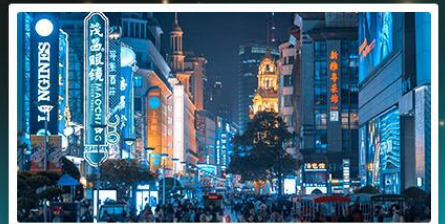
ป่าเปลี่ยนสีทะเลสาบชิงชาน