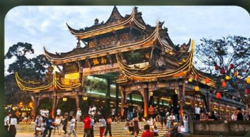
เมืองโบราณกวนเสี้ยน