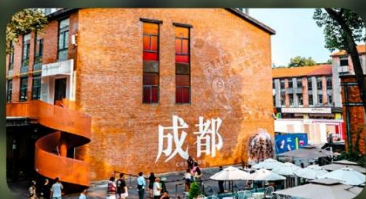
ดงเจียวจี้