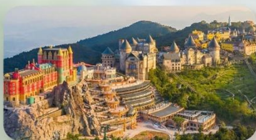
เที่ยวบานาฮิลล์เต็มวัน