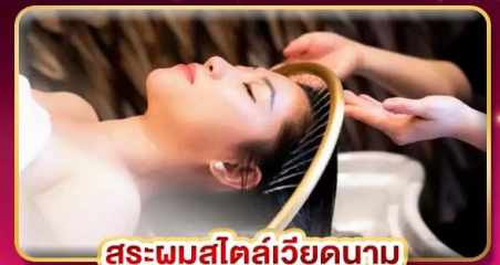
สปาสมุนไพรเวียดนาม