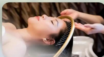
สระผสมสไตล์เวียดนาม