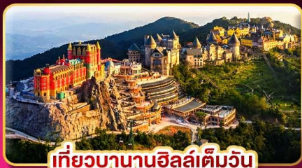
เที่ยวบานาฮิลล์เต็มวัน

ล่องกระทงขามดำคืนที่ฮอยอัน โพล์สวย บินเช้า-กลับเย็น