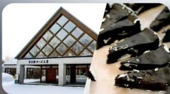
โรงงานชีสฟุราโน