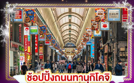
ช้อปปิ้งถนนทานุกิโคจิ