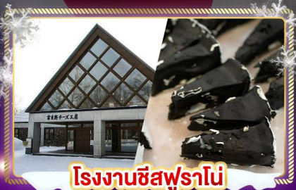
โรงงานชีสฟุราโนะ