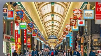
ซ้อปปิ้งถนนทากุจิโคจิ