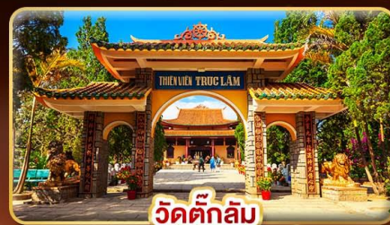
วัดตึกลิ้ม