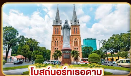
โบสถ์นอร์ทเรอดาม