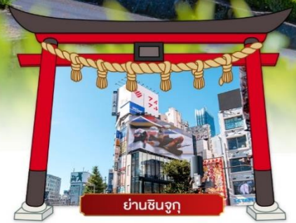
ย่านชินจูกุ

เดินทางโดยสารการบิน : ไทยแอร์เอเชียเอ็กซ์