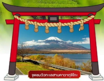
จุดชมวิวกะเลสาบคาวากูจิโกะ