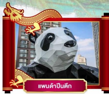
แพนด้าปิ่นดึก